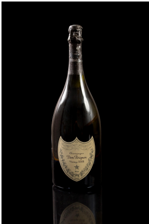
Dom Perignon $1450 2008 yrs (1.5L)