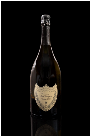
Dom Perignon $1200 2010 yrs (1.5L)